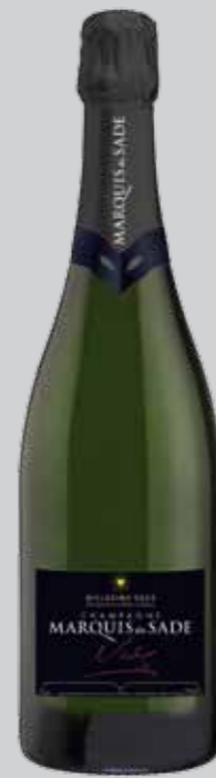
Magnum Blanc de Blancs Grand Cru Millésime 2002