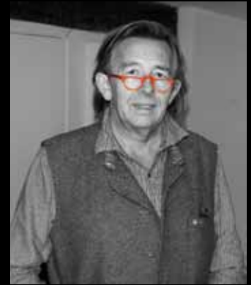
Hugues de Sade