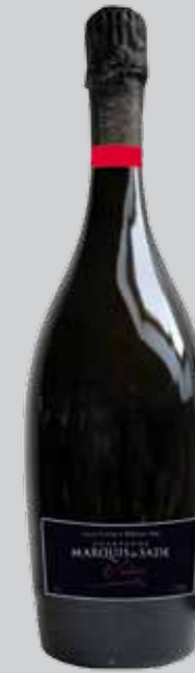
Cuvée Prestige Blanc de Blancs Grand Cru Millésime 2004