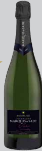
Blanc de Blancs Grand Cru Millésime 2002