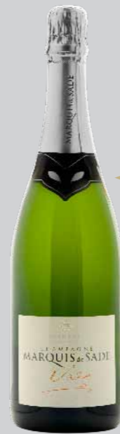
Blanc de Blancs Grand Cru